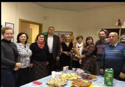
25 октября весело и дружно отметили День рождения компании! В 2018 году ей исполнилось 23 года!