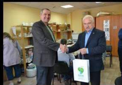
На Дне открытых дверей в интеграционных мастерских общественной организации «Верас» во время #щедроговорника