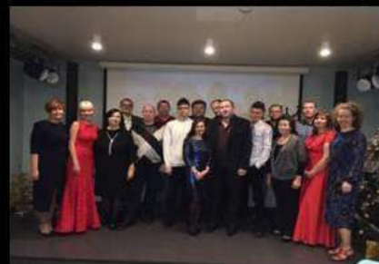
21 декабря зажигательно отметили новогодний корпоратив в одном из ресторанов нашего города