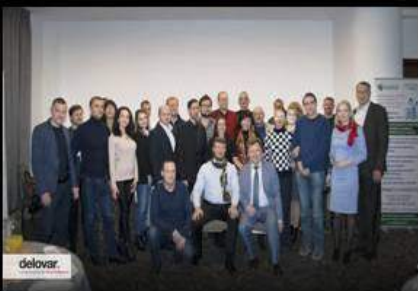
Компания «БИОС» вступила в деловой клуб предпринимателей «Деловар» в Нижнем Новгороде